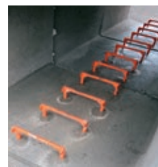
Particolare con gradini installati.