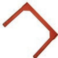
Gradino acciaio plastificato

Fori per inserimento gradini distanziati di 25 cm.