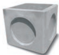
Pozzetto rinf. 80x80