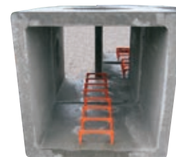
Su richiesta, si possono fornire già inseriti. Vedi supplemento